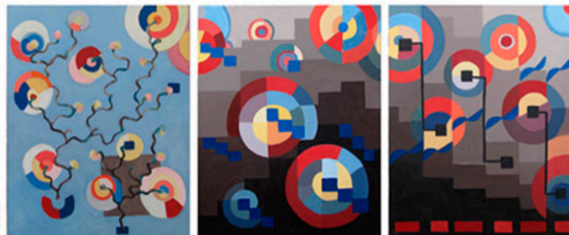
Fantaisie en Sol Majeur de J.-S. Bach, ©Marie Gabriel, 2007

Cette manifestation permet au public d'aborder les relations entre les arts, avec une "mise en regard" des œuvres musicales jouées par Lucie Flesch à l'orgue et des "phrases musicales" de Marie Gabriel.